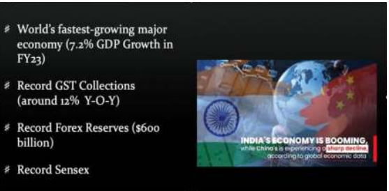
Figure 1: India is Booming

ഞാൻ വിശ്വസിക്കുന്ന, രണ്ടാമത്തെ യാഥാർത്ഥ്യം ചിത്രം രണ്ടിൽ കാണിച്ചിരിക്കുന്നതു പോലെ ഇന്ത്യ ബുദ്ധിമുട്ട് നേരിടുകയാണ്.