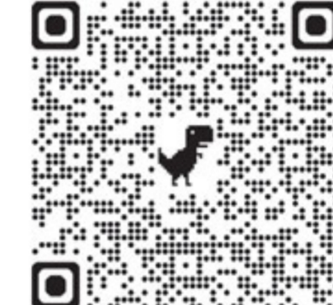
ആഗോള പ്രവചന മാതൃകയുടെ മുൻ ലക്കങ്ങൾ വായിക്കാൻ ക്യാന്റർ കോഡ് സ്കാൻ ചെയ്യുക.

ഇത് കേവലം രാഷ്ട്രീയമല്ല- യൂഎസിന്റെ സാമ്പത്തിക പ്രവർത്തന സംവിധാനത്തിലെ മാറ്റമാണ്. ഈ മാറ്റങ്ങൾ നേരത്തെ മനസിലാക്കുന്ന ബിസിനസുകൾക്ക് വലിയ നേട്ടമുണ്ടാക്കാം. കാത്തിരിക്കുന്നവർ, റോബോട്ടിക്സിനും ഓട്ടോമേഷനിലേക്കും കുറഞ്ഞ റെഗുലേഷൻ സാഹചര്യങ്ങളിലേക്കും ആദ്യം എത്തിയ എതിരാളികളാൽ മറികടക്കപ്പെട്ടേക്കാം. ■