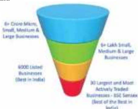
Figure 1 - BSE Sensex - Best of the Best Businesses in India

ബി.എസ്.ഇ സെൻസെക്സിലെ കമ്പനികൾ ഇന്ത്യയിലെ ഏറ്റവും മികച്ച ബിസിനസുകളാണെന്ന് ന്യായമായ അനുമാനമാണ്.