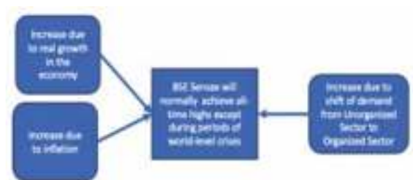
Figure 4 - Reasons for BSE Sensex achieving all-time highs

ഞാൻ വിശദീകരിച്ച കാര്യങ്ങൾ പഠിക്കാനും ഇന്ത്യൻ സമ്പദ്വ്യവസ്ഥ യഥാർത്ഥത്തിൽ കുതിപ്പിലാണോ എന്നതു സംബന്ധിച്ച് സ്വയം നിഗമനത്തിലെത്താനുമുള്ള അവകാശം വായനക്കാർക്ക് വിടുന്നു.