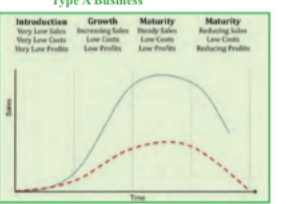
Figure 4: Typical Life Cycle of a Type A Business

സെലിക്ട് ചെയ്ത: ബിസിനസ്സുകൾ ഉപയോഗിക്കാൻ പര്യാപ്തമായ സാധ്യതകൾ ഉണ്ടാകാൻ സാധ്യമാകും. സെലിക്ട് ചെയ്ത ബിസിനസ്സുകൾ ഉപയോഗിക്കാൻ പര്യാപ്തമായ സാധ്യതകൾ ഉണ്ടാകാൻ സാധ്യമാകും.