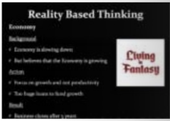
ചിത്രം 2 - Living in Fantasy - Economy

നിർഭാഗ്യവശാൽ സമ്പദ് വ്യവസ്ഥ മാന്യത്തിലായിരിക്കുകയും മത്സരം കടുക്കുകയും ചെയ്തതോടെ അഞ്ചു വർഷത്തിനു ശേഷം ബിസിനസ് അടച്ചുപൂട്ടേണ്ടി വരുന്നു. ഫാൻസിയിൽ ജീവിക്കുക എന്നാണ് ഞാനിതിനെ വിളിക്കുക.