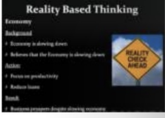
ചിത്രം 3 - Reality Based Thinking

സമ്പദ് വ്യവസ്ഥ മാന്യത്തിലാണെങ്കിലും ഈ സംരംഭകന്റെ ബിസിനസ് അഭിവിദ്യപ്പെടുന്നു. യാഥാർത്ഥ്യത്തെ അടിസ്ഥാനമാക്കിയുള്ള ചിന്ത (Reality Based Thinking) എന്നാണ് ഞാനിതിനെ വിശേഷിപ്പിക്കുക.