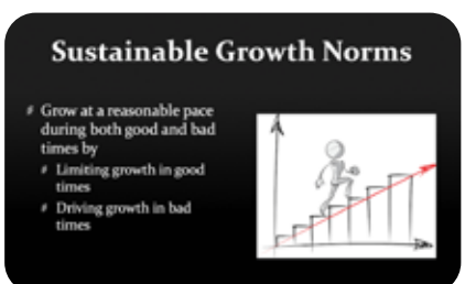
ചിത്രം 4: Sustainable Growth Norms

സുസ്ഥിര വളർച്ച നേടാൻ സംരംഭകർ ചിത്രം നാലിൽ കാണുന്നതു പോലെ നല്ല സമയത്ത് വളർച്ച പരിമിതപ്പെടുത്തുകയും മോശം സമയത്ത് വളർച്ച നിലനിർത്തുകയും ചെയ്യുന്നതു പോലെയുള്ള ചില മാനദണ്ഡങ്ങൾ പാലിക്കേണ്ടതുണ്ട്.