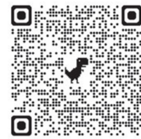
ആഗോള പ്രവചന മാതൃകയുടെ മുൻ ലക്കങ്ങൾ വായിക്കാൻ ക്യാആർ കോഡ് സ്കാൻ ചെയ്യുക.

ആഗോള പ്രവചനങ്ങളെക്കുറിച്ചുള്ള എന്റെ ലേഖന പരമ്പര ഈ ലേഖനത്തോടെ അവസാനിപ്പിക്കുന്നു. ■