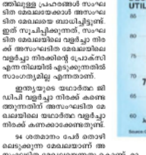
Figure 2: Manufacturing Sector Capacity Utilizations

ഇന്ത്യൻ സമ്പദ് വ്യവസ്ഥയ്ക്ക് ഇതിന് വലിയ സ്വാധീനമുണ്ടാകും. 2019-20 സാമ്പത്തിക വർഷത്തിൽ 39 വർഷം കേന്ദ്ര സമ്പദ് വ്യവസ്ഥയ്ക്ക് ഇതിന് വലിയ സ്വാധീനമുണ്ടാകും.