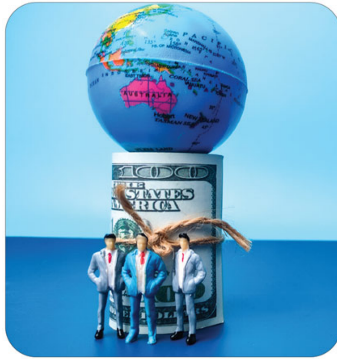
Figure 1: Global Prediction Model

ചിത്രം ഒന്നിൽ കാണിച്ചിരിക്കുന്ന, എന്റെ 'ആഗോള പ്രവചന മാതൃക' ലോകത്തെ കാണുന്നത് കാരണങ്ങൾ (Causes), പ്രവർത്തനങ്ങൾ (Actions), ഫലങ്ങൾ (Effects) എന്നിങ്ങനെയാണ്.