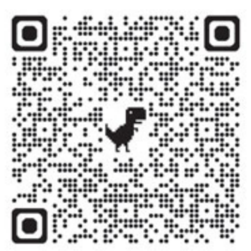
ആഗോള പ്രവചന മാതൃകയുടെ മൂന്ന് ലക്കങ്ങൾ വായിക്കാൻ ക്ലിക്ക് ചെയ്യുക.

സാമ്പത്തിക വളർച്ച വീണ്ടെടുക്കുക, ബജറ്റുകൾ സ്ഥിരപ്പെടുത്തുക, ഉൽപാദന മേഖലയെ പുനർവ്യവസായവൽക്കരിക്കുക, വ്യാപാര മേഖലയെ പുനർനിർമ്മിക്കുക തുടങ്ങിയവയിലൂടെ യുഎസ് ഒരു സമ്പൂർണ്ണ സാമ്പത്തിക പുനഃക്രമീകരണത്തിന് ശ്രമിക്കുന്നതായി കാണുന്നു. ■